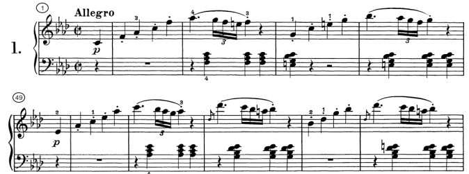
Abbildung 1: Variationen des „Mannheim-Themas“ in den Takten 1-4 und 49-53 des ersten Satzes der Klaviersonate Nr.1 von Beethoven (Op. 2 Nr. 1 Satz 1).

Barlow und Morgenstern verzeichnen in [1] insbesondere Themen, die besonders prägnant für ein Stück sind. Dieser Umstand sollte bei der automatischen Identifizierung berücksichtigt werden. Wenn zum Beispiel ein Thema mehrfach in einem Stück gefunden werden kann, so gibt dies einen starken Hinweis darauf, dass das Stück korrekt durch das Thema identifiziert wird. Dabei ergibt sich jedoch das Problem, dass ein Thema typischerweise nicht in exakt gleicher Form wiederholt wird, sondern stets leicht modifiziert. In Abb. 1 wird dies anhand einiger Takte aus der Sonate Nr.1 von Beethoven illustriert. Das in [1] zu diesem Stück verzeichnete Thema findet sich in der rechten Hand der ersten beiden Takte, eine Variation des bekannten Mannheim-Themas. Dieses Thema wird mehrfach wiederholt, so in den Takten 3 und 4, 49 und 50 sowie 52 und 53. Obwohl die Wiederholungen in sehr ähnlicher Form aufzutreten scheinen, finden sich