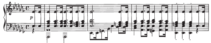
Abbildung 2: Takte 1-4 des dritten Satzes der Klaviersonate Nr.12 von Beethoven (Op. 26 Satz 3).

dennoch deutliche Unterschiede. Zum Beispiel verändert sich zwischen Takt 1 und 3 nicht nur die Harmonie (f-Moll nach C-Dur), sondern auch die Melodie. Während im ersten Takt zwischen der ersten und zweiten Note drei Halbtonstufen liegen (F nach As), findet man an der gleichen Stelle im dritten Takt fünf Halbtonstufen (G nach C). Selbst aus musikwissenschaftlicher Sicht ist nicht im Allgemeinen definiert, wann eine Notenfolge eine modifizierte Variante eines gegebenen Themas darstellt. Alle Modifikationsmöglichkeiten beim Matching in robuster Weise zu berücksichtigen, stellt technisch somit eine große Herausforderung dar.